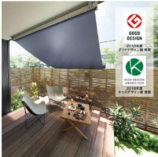
インディゴデニム