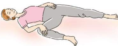
ストレッチは無理のない範囲で行いましょう

することもとても大切。股関節が硬いとケガなどのリスクが高まります。簡単なストレッチとしては、仰向けに寝て片足の膝を胸へ引き寄せ、膝で円を描くように回します。ほかに、仰向けで寝て片足の膝を90度曲げます。膝の内側付近に手を添え、そのままゆっくり側面の床に倒します。そのとき、足を伸ばした側の腰が浮きすぎると十分に伸ばせないため、足を伸ばした側の手で鼠径部付近を押さえましょう。