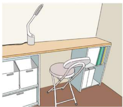
カラーボックス2つに天板を渡せば、省スペースで収納兼デスクが実現！

小さい空間でもいいから自分のスペースが欲しい！ということなら、奥行きが浅いコンソールテーブルや、壁面に設置でき、必要なときだけ使える折り畳み式のテーブル、はしご型の机などを活用するのも手です。収納と机が一体型になったライティングビューローもおススメ。ライティング