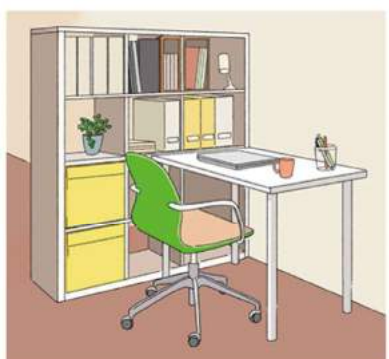
観葉植物や写真を飾るなど、好きなモノを凝縮させるのも素敵♪

いなら、椅子は疲れないタイプを選ぶのがおススメ。背もたれがメッシュになった、背中が蒸れないタイプや、リクライニングができるものなど、自分に合ったものを吟味しましょう。