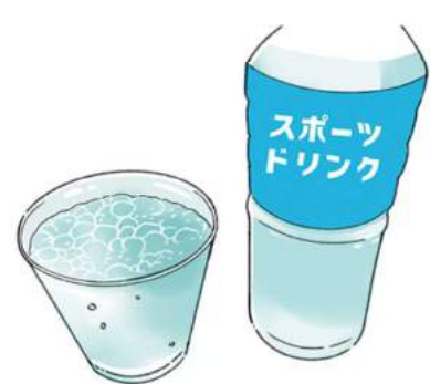
アイススラリーは、製氷皿でボトル 2/3 のスポーツドリンクを凍らせ、残り 1/3 のドリンクと一緒にミキサーにかければOK

最近、話題になっているのが「暑熱順化」。暑さに体を慣らすことで、適度に汗をかくと、体温の上昇が抑えられるので、普段からウォーキングなどの運動をし、汗をかくことを意識することが大切。汗をかけたら水分と塩分を補給する習慣を身につけると良いですね。