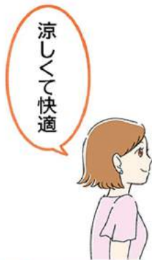
美術館や映画館で涼みながら芸術に触れるのも良いですね♪

ほかにもちよつとの工夫で節電に。カーテンやブラインドで直射日光を防ぐとお部屋の快適さもアップ。遮熱カーテンもおすすめです。暑いと冷蔵庫を開ける回数も増えますが、開けると冷気が外に漏れ、閉めた時に冷やそうと電力を消費するので、開閉の回数を減らすことも大切です。電力に頼らないアイテムを使うのもおすすめ。涼感タイプの敷きマット