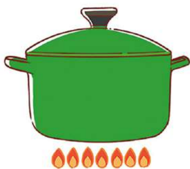
お湯を沸かすときはフタをすることで、熱が逃げるのを防ぎ、早く沸くので省エネにつながります。

料理のときに、煮込み料理は長時間火にかけなければいけません、短時間で仕上がる圧力鍋や、保温性が高い鍋を使うことも手です。保温性が