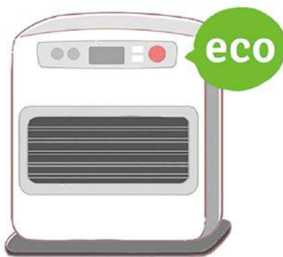
暖房器具は、暖めすぎを防ぐエコ運転などを利用するのも良いですね！

●ガスを使った暖房器具を使うとき ガスファンヒーターは、フィルターを掃除することで、運転効率の低下を防ぎ、ガスの節約になります。暖房器具の設定温度を低くし、厚手のカーテンや着るものに工夫すれば節約になりますね。