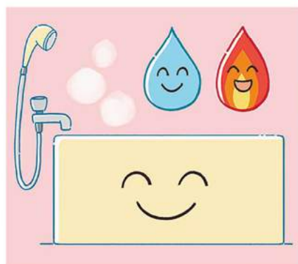
お風呂の使い方を工夫すれば、ガスだけでなく、水の節約にもつながるので一石二鳥ですね！

●お風呂を使うとき 家族で入浴する場合、時間を空けずに入ること、追い炊きやお湯を足す時間が減り、ガスの節約になります。シャワーはできるだけ出しっぱなしにせず、使うときだけにすると、ガスだけでなく水道の節約にもなります。また、浴槽のお湯を利用することで、シャワーを使う時間が短くなるだけでなく、水の節約にもなります。節水タイプのシャワーヘッドなら、水压を変えることなくお湯の使用量を減らせるだけでなく、細かい水流で効果的に洗い流すことができるので、ガスや水の節約につながります。