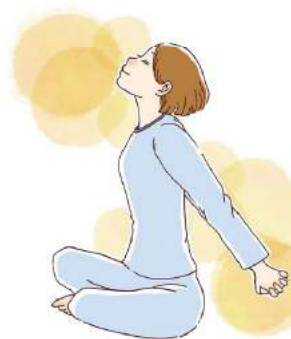
イラスト②ストレッチは一つの動きにつき、10〜15秒程度が目安。無理のない範囲で行いましょう。

起きてからのストレッチは、仰向けになり、手を組んで上にあげ、手足を伸ばしてキープし、その後脱力。3〜5回繰り返しましょう。あぐらをかくか、椅子やベッドに座つ