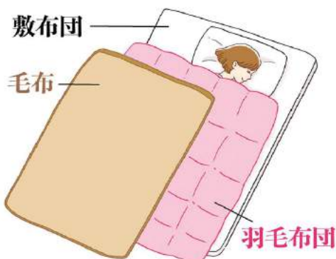
羽毛布団と毛布を使うときは、毛布を上にした方が羽毛布団の保温機能を十分に活かせます。

起床後は口腔ケアをしてから、コップ1杯の水を飲みましょう。寝ている間に失われた体内の水分を補い、血液の流れをスムーズにするメリットが。