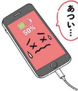
バッテリーのダメージに気を付けて、スマホを長持ちさせたいですね。