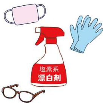
塩素系漂白剤はゴム手袋やメガネ、マスクなどをしてご使用を。

あり、酸性のものと混ぜると危険なので、ご注意を。 浴室を使用後、吸水スポンジやスクイーズで水気を取ると掃除の負担が軽くなります。