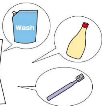
在庫管理をしっかりし、必要なモノをメモすることで、まとめ買いの際にも重宝します。

ることで、配送の混雑を軽減させることができるともいえます。 ●まとめ買いで配達回数を減らす 買いたいモノのオーダーは、その都度するのではなく、ある程度、まとめですることで、配達回数を減らすことができます。