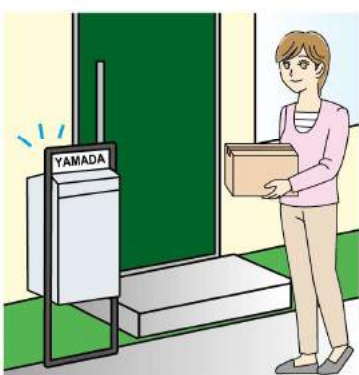
宅配ボックスは、おしゃれなデザインのものもあるので、検討する価値ありますよ。

●置き配や宅配ボックスの活用を 利用する人も多くなってきた置き配。置き配を使うことで、再配達の負担が減ります。雨風や防犯上、心配なから、指定場所を車庫や物置など玄関以外にすることや、宅配ボックスの利用もおすすです。