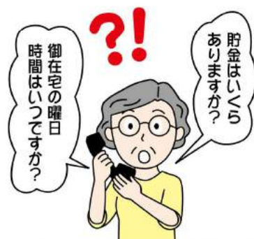
電話などで在宅状況や家族の状況、資産状況を聞かれてもむやみに答えないようにしましょう。

ほかに、合鍵の不正製作を防止するため、鍵は家族以外に見せたり渡したりしない、写真や動画に写り込ませないこと。自宅に必要な以上の現金をおかないことも大切です。