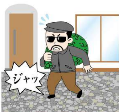
歩くとき大きな音がする防犯砂利というものもあります！建物の周辺に敷くと効果的です。

●「時間」：警察庁が窃盗犯からヒアリングしたところ、約7割が侵入に5分以上かかると断念するそうです。そのひとつに、鍵を開けるときに時間がかかることを嫌います。家の玄関や勝手口は「1ドア2ロック」が最適。補助錠や後付けできる電子錠を付けたら、2ロックタイプのドアにリフォームする