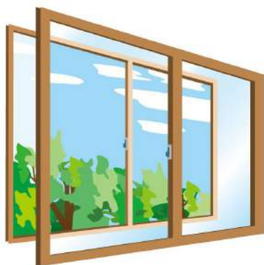
内窓の設置もおすすめ。窓を開けるのに時間を要します。

個室は高いところにあるので油断しがち。雨どいなどを使って上がることもあるので必ず施錠しましょう。ワイヤー入りガラスの窓は防火目的で防犯ガラスではなく、たたき割っても飛散しにくいので、逆に狙われることがあるのだとか。そこで、2枚のガラスの間に特殊なフィルムを挟みこんだ窓がおすすめ。早急に対策をするなら補助錠が最適ですよ。