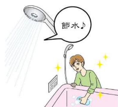
最新の設備にすることで、節水などの省エネや掃除がしやすくなるといったメリットも。

あります。ほかに ・換気扇から異音がする ・床がへこむ ・ドアの開閉がしづらい ・蛇口から水が漏れる ・排水口の流れが悪い ・排水口からニオイがする… といった不具合も、見逃せません。1カ所の不具合を修理するだけで済む場合もありますが、その傷みがとても気になる、もしくは、複数ある場合