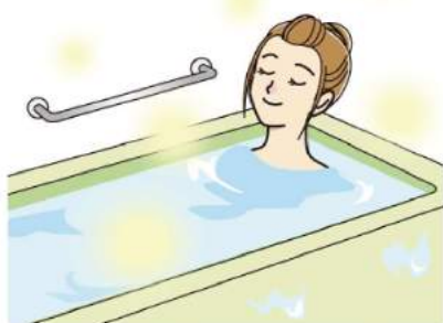
新しい浴室で快適さをアップデートするのも良いですね！

を解消したい、デザインを一新したい、新たな設備や機能を追加したいなど、リフォームの優先順位を考えておくと、相談がスムーズです。また、機能やオプションを追加すると費用は高くなるため、優先順位を考えることは、工事内容を絞りやすくすることにもつながります。事前にリフォームの費用相場を調べ