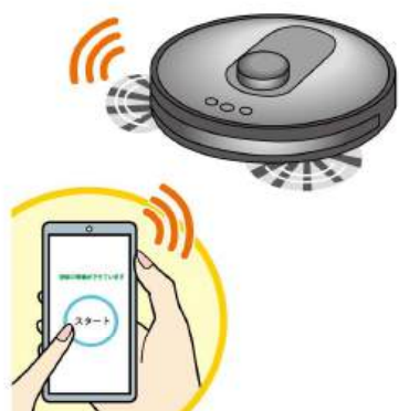
スマホと連動できるタイプなら、お出かけ中でもスマホからスタート！

て以上の家でも各階に持ち運べば掃除してくれるので、掃除の時間を軽減することができます。 ・掃除範囲によって機種を選べる…コンパクトな部屋を掃除するなら、一般的なタイプで十分。複数の部屋を掃除する場合は、部屋の間取りを認識できる内蔵のセンサーがついたタイプがおすすめです。 ・拭き掃除ができるタイプも…ゴミを吸い込んだ後に拭き上げるため、雑巾がけの手間が省けます。