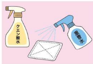
トイレの黄ばみやニオイには重曹水が、尿汚れにはクエン酸水が便利。ぬるま湯200mlに、重曹水は重曹大さじ1杯程度、クエン酸水はクエン酸小さじ1杯程度を溶かしてそれぞれスプレーボトルに入れます。

皮脂や汗、ホコリなどで汚れが溜まりがちになり、ニオイの原因に。普段からまめに掃除機がけを。