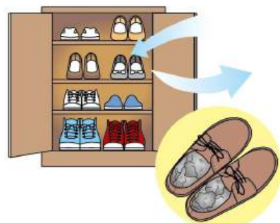
湿気がニオイの原因になるため、ときどき扉を開放させて換気。靴の湿気取りに吸水性の高い新聞紙やキッチンペーパーを入れるのも手です。

靴のニオイや湿気が原因です。 ・履いた靴はしっかり乾燥を…靴専用の乾燥機や布団乾燥機に靴用のアタッチメントの使用がおすすめ。 ・靴の汚れを取る…土などから雑菌が繁殖し、ニオイやカビの原因に。しっかり落としましょう。 ・重曹が消臭剤に…重曹をビンに入れるだけ。エッセンシャルオイルやハッカ油を入れるのも良いですね！