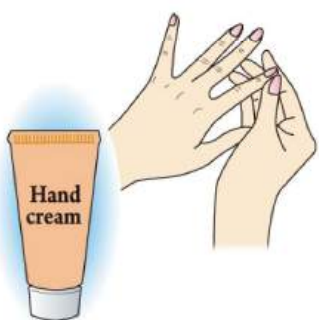
水仕事や手洗い、消毒で手肌の乾燥も気になりますね、ハンドクリームを指先までしっかり塗って保湿をしましょう。

顔につける化粧水や乳液も保湿性のあるタイプが良く、さらに保湿力を高めるなら、クリームの使用がおすすめです。説明書にある量を取り、4本の指にクリームをなじませて、両頬、おでこ、鼻、あごの5点におき、4本の指の腹をつかって細かく円を描くように伸ばします。お肌を強くこするようになると、摩擦でお肌をいためるので「優しく」が基本ですよ。目元まわりや首、デコルテも忘れず塗りましょう。