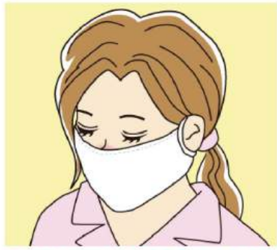
マスクは不織布が手軽ですが、シルクや綿が素材の一部に使われているタイプはよりお肌に優しく、おすすめです。