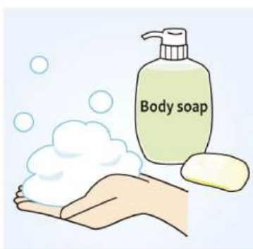
石けんやボディソープは、良く泡立てて使うことで肌への摩擦を軽減させ、乾燥対策につながります。

顔につける化粧水や乳液も保湿性のあるタイプが良く、さらに保湿力を高めるなら、クリームの使用がおすすめです。説明書にある量を取り、4本の指にクリームをなじませて、両頬、おでこ、鼻、あごの5点におき、4本の指の腹をつかって細かく円を描くように伸ばします。お肌を強くこするようになると、摩擦でお肌をいためるので「優しく」が基本ですよ。目元まわりや首、デコルテも忘れず塗りましょう。