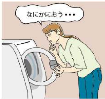
焦げ臭いにおいは、洗濯機内部の部品が摩耗している可能性があり、危険です。ただちに使用をやめてメーカーに相談することをおすすめします。

異音は要注意です。「キュルキュル」という音はベルトのすり減り、「ガリガリ」「カタカタ」はモーターの劣化やベルトの緩みの可能性が。「ブーン」という音は給水バルブの異常が考えられます。メーカーや電器屋さんに相談の上、故障が考えられれば、修理をするなどの対処を。修理の相談で高額になるようなら、買い替えを検討するのもアリです。