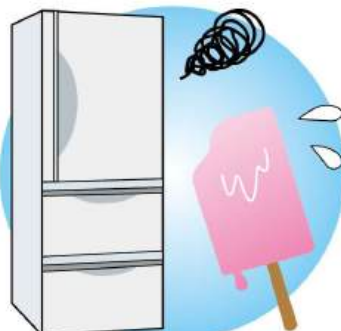
アイスなどが溶けてしまうなど症状があれば、内部の機械や部品の不具合の可能性。メーカーや電器屋さんにご相談を。

場合は「寿命が近い?」と考えてみるのも良いのかもしれませんが。洗濯機の水漏れは箇所を特定し、洗浄してもさびや汚れが取れない場合やパッキンなどの部品が劣化していれば、部品交換が必要になります。