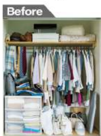
枕棚とパイプが1本の一般的なクローゼットが...