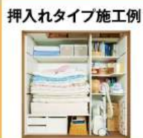
押入れタイプ施工例