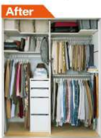
管理が楽で出し入れしやすい機能的なクローゼットに