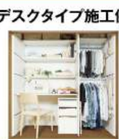
デスクタイプ施工例