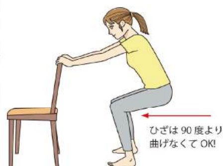
スクワットは、膝がつま先より前に出ないことがポイント！浅くしゃがんでも、太ももの筋肉を意識しながら行うことが大切です。

●もも上げ…腰回りの筋肉はもちろん、特に、背骨や骨盤、太ももの骨をつないでいる大腰筋が鍛えられます。足を引き上げるときに使う筋肉なので、転倒予防にもなります。