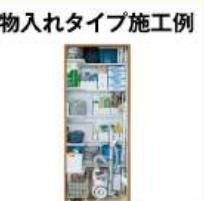
物入れタイプ施工例