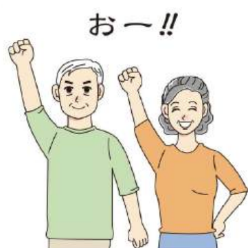
筋肉量は何歳からでも増やすことができます！

おー!! が期待できるといった良いことも。何より、鍛えることで筋肉量が増えると思うように動いて自信につながります。日々のウォーキングも良いですが、おうちで、短時間でできる足腰を鍛える運動もおすすめ。ぜひ参考にしてくださいね。